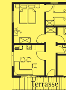
Buchenbach Hütte I Erdgeschoß links