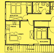
Buchenbach Hütte II Erdgeschoß